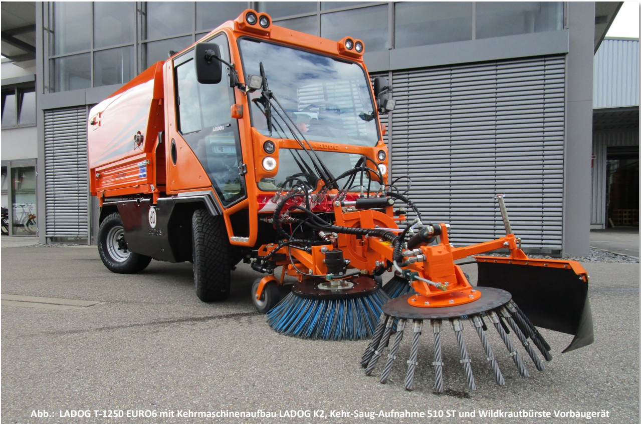
Abb.: LADOG T-125D EURO6 mit Kehrmaschinenaufbau LADOG K2, Kehr-Saug-Aufnahme S10 ST und Wildkrautbürste Vorbaugerät