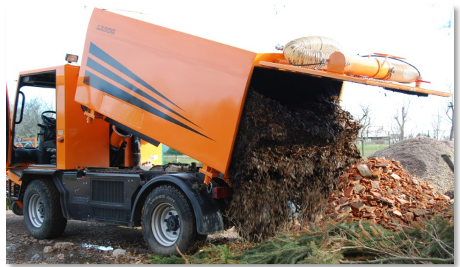
Einfache Entleerung auf Deponien oder in Container