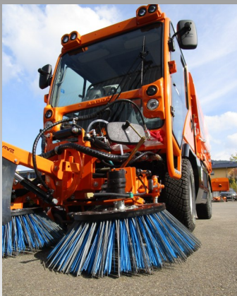
Robuste Tellerbesen sorgen für ein perfektes und sauberes Ergebnis auf jedem Untergrund