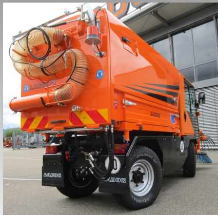
Rückansicht Kehrmaschinenaufbau mit Handsaugschlauch und Ausleger für schwer erreichbare Stellen (z.B. unter Parkbänken)