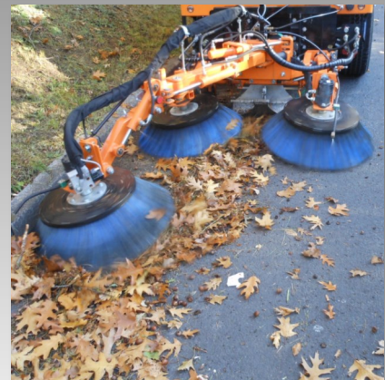
Sinnvolle Ergänzungen: als dritte Einheit ein steuerbarer Tellerbesen für größere Reichweite oder eine Wildkrautbürste zur Wildwuchsbekämpfung