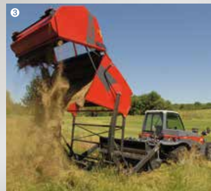
③ Die Modelle 150 cm und 180 cm sind mit Boden- oder Hochentleerung 210 cm erhältlich.